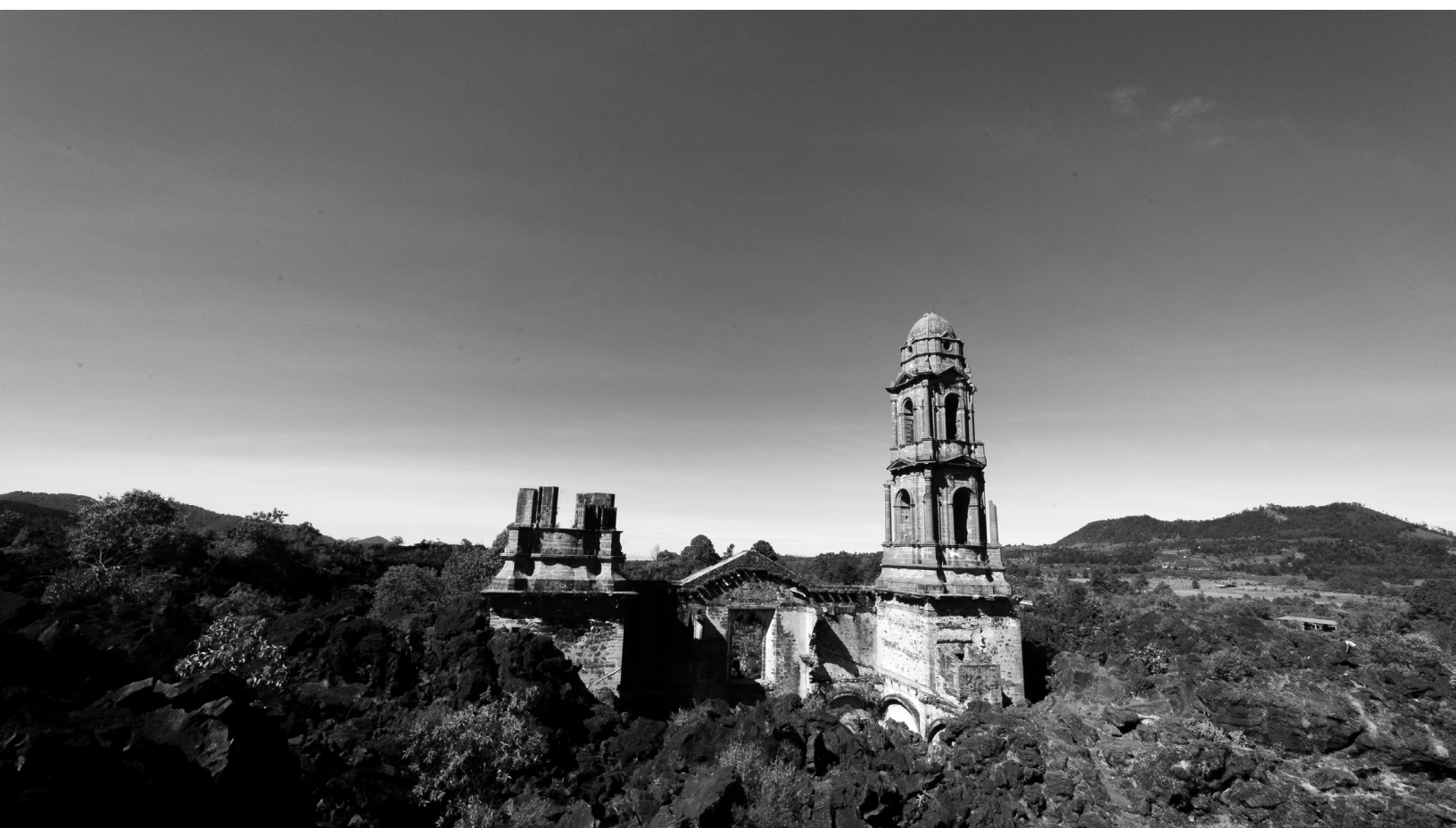
Ruinas de San Juan Viejo / / 25.11.2018