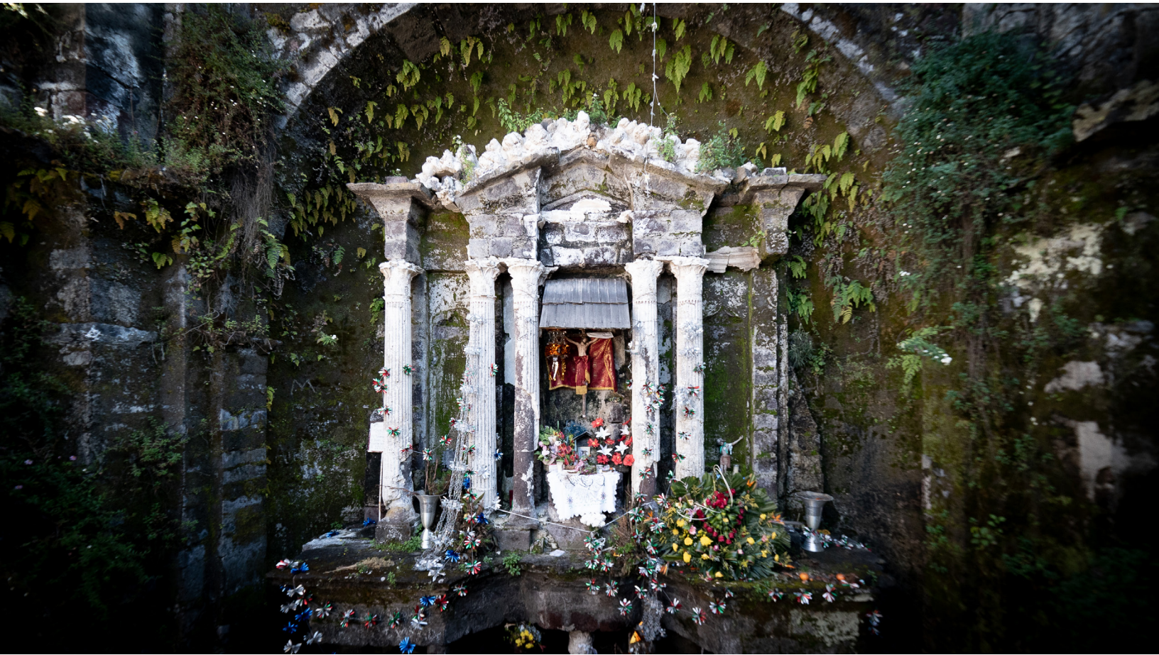
Retablo del templo en ruinas de San Juan Viejo / / 25.11.2018