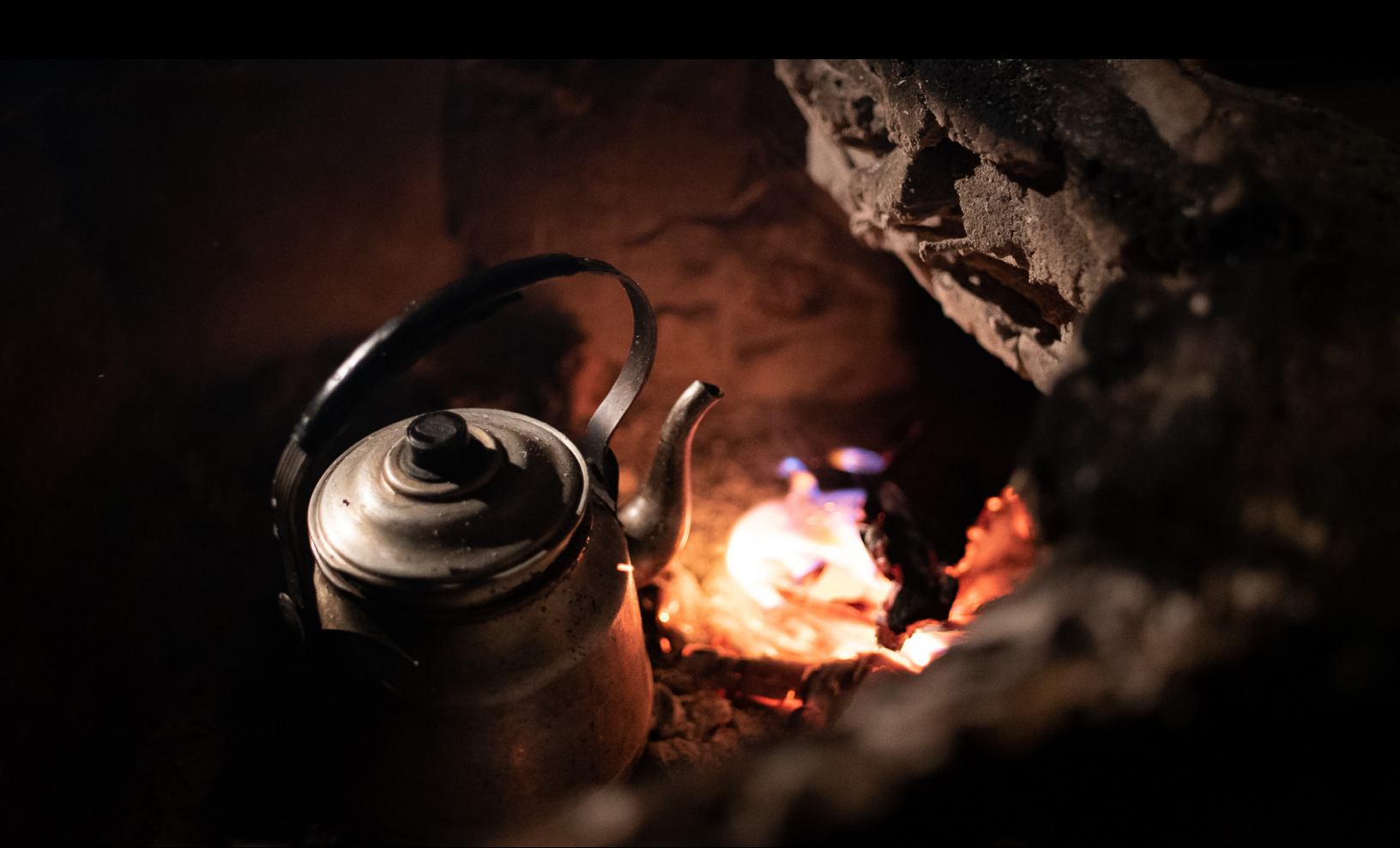
Puesto de Cachuy, Ruinas de San Juan Viejo / / 25.11.2018