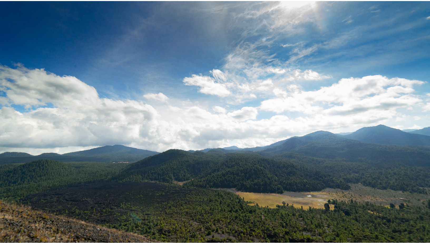
Lavas Parícutin / / 24.11.2018