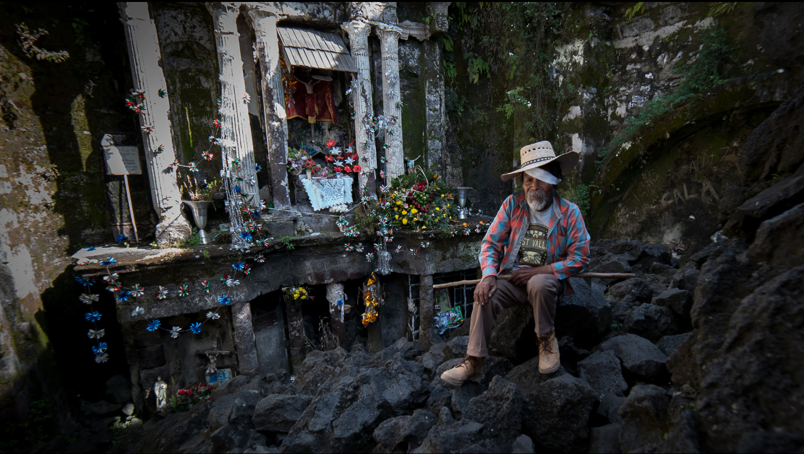
Retablo del templo en ruinas de San Juan Viejo (Francisco Lázaro) / / 25.11.2018