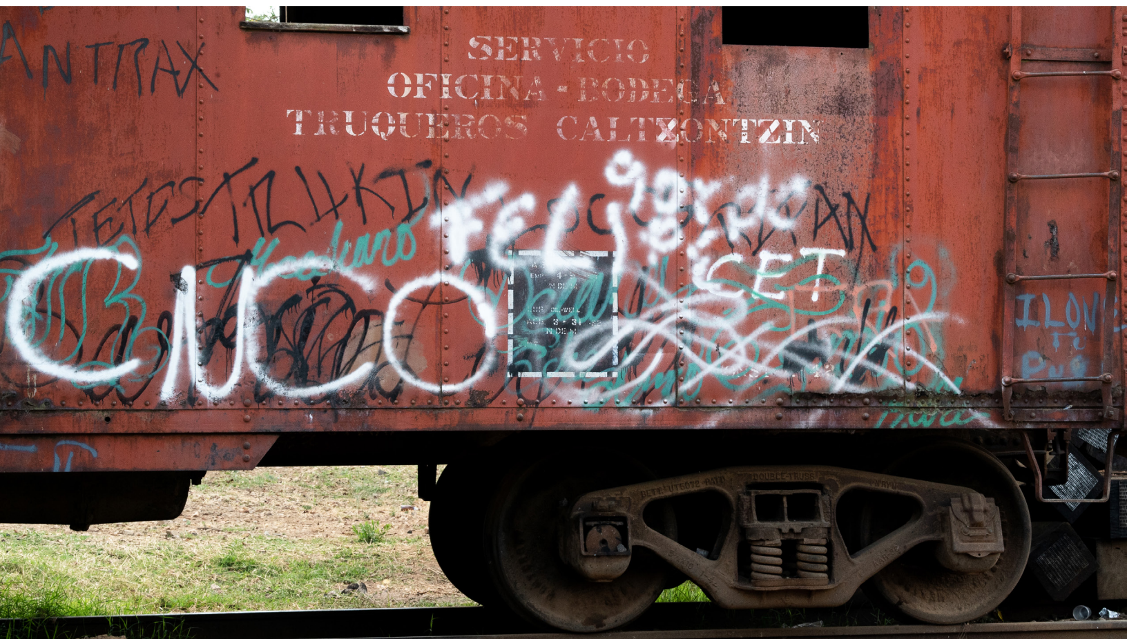
Vagón del tren Calzontzin / 17.03.2019