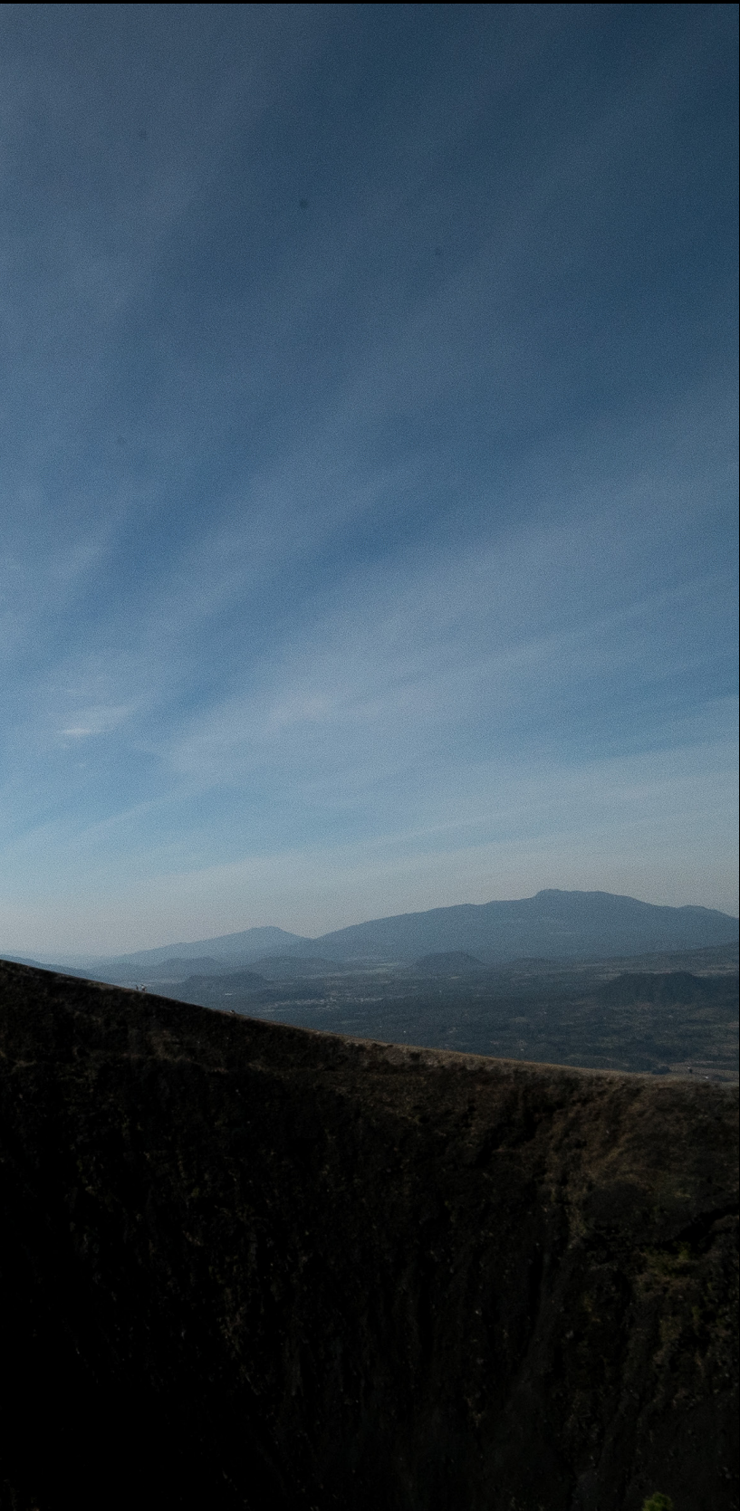
Cráter de Parícutin