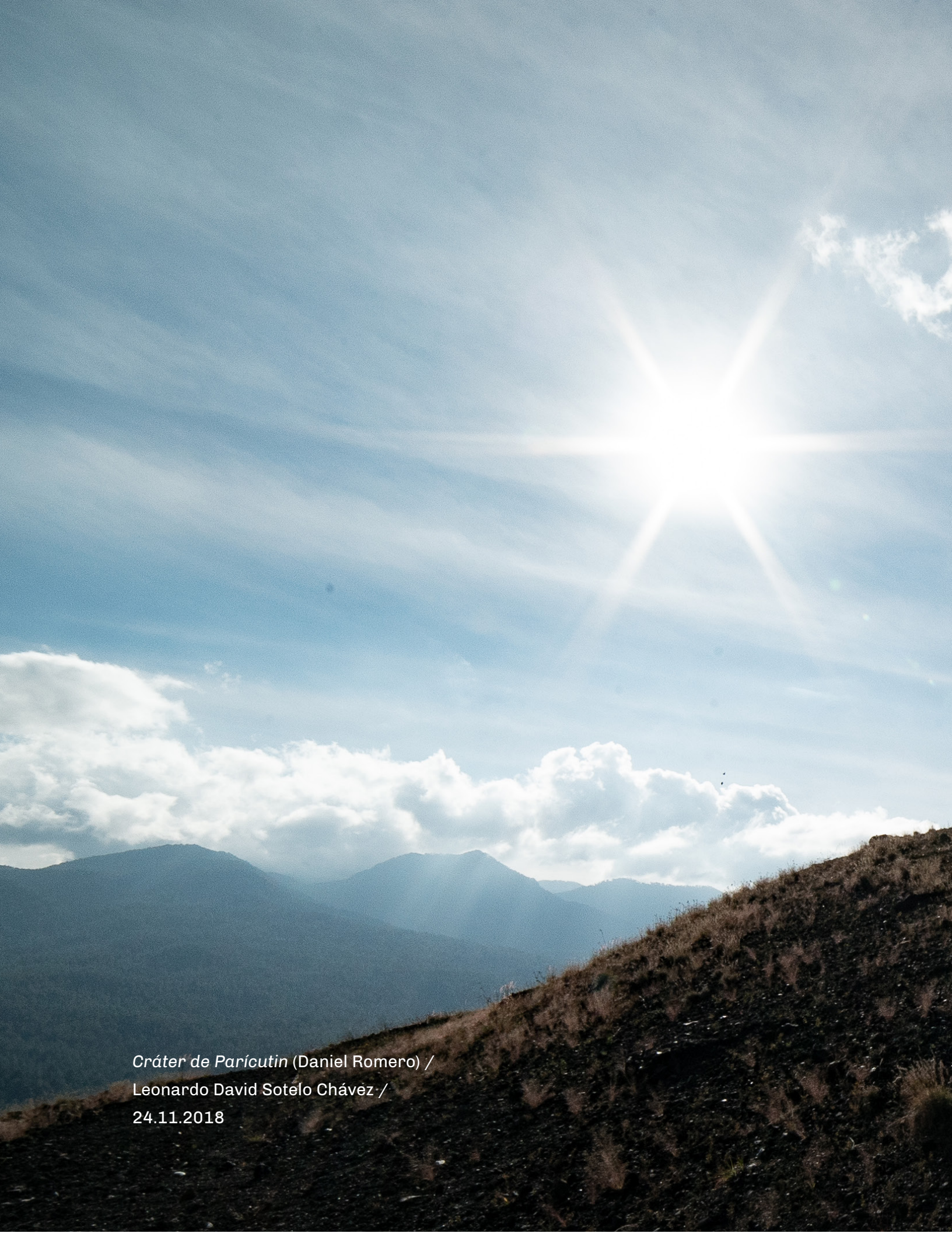
Cráter de Parícutin / 24.11.2018