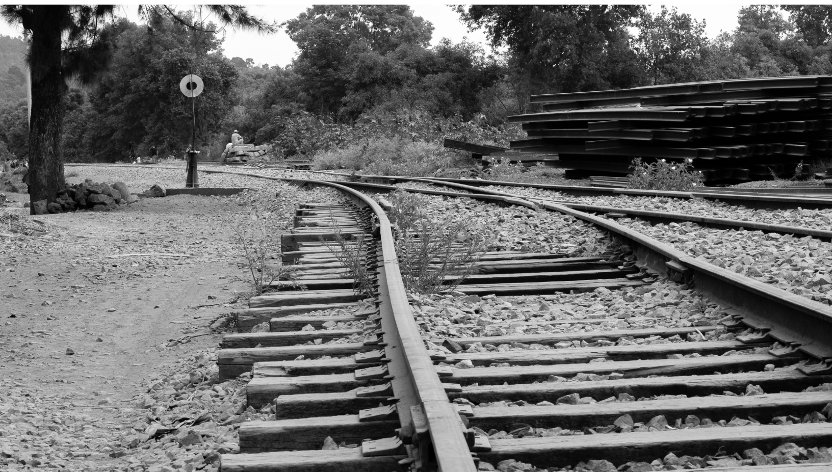
Vías del tren, Caltzontzin / 17.03.2019