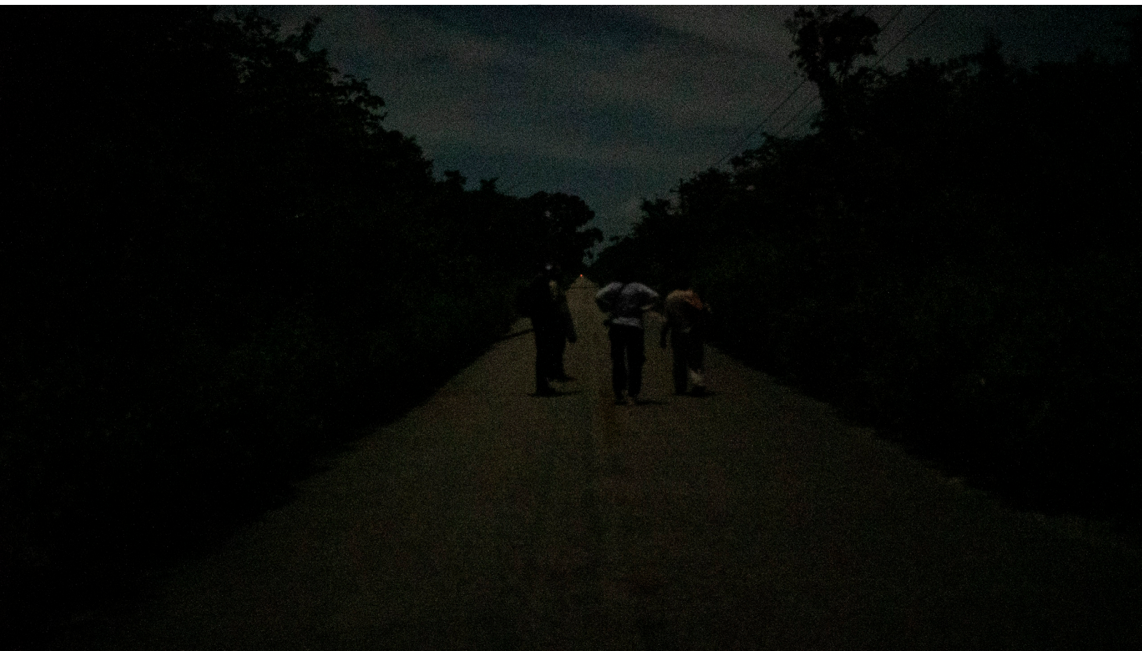
Las nubes de noche / Nuevo Durango, Quintana Roo / / 15.12.2021