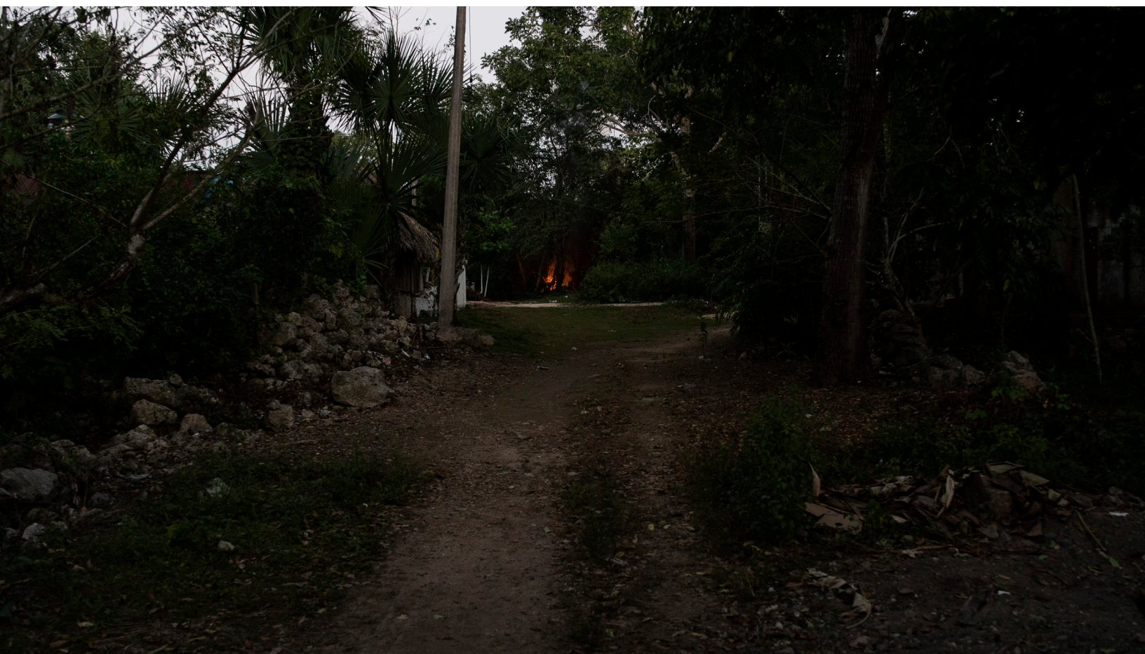
El fuego / Nuevo Durango, Quintana Roo / / 14.12.2021