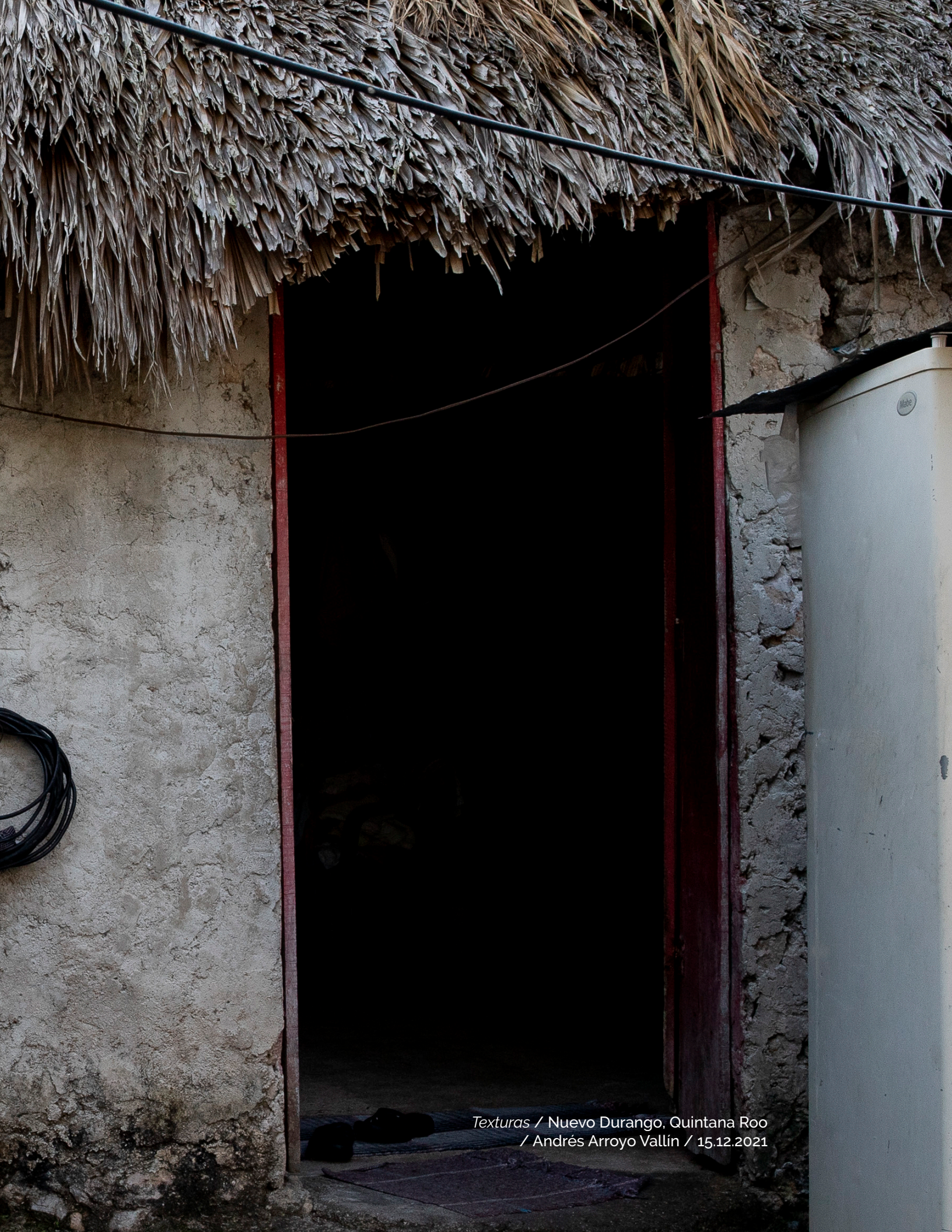
Texturas / Nuevo Durango, Quintana Roo / / 15.12.2021