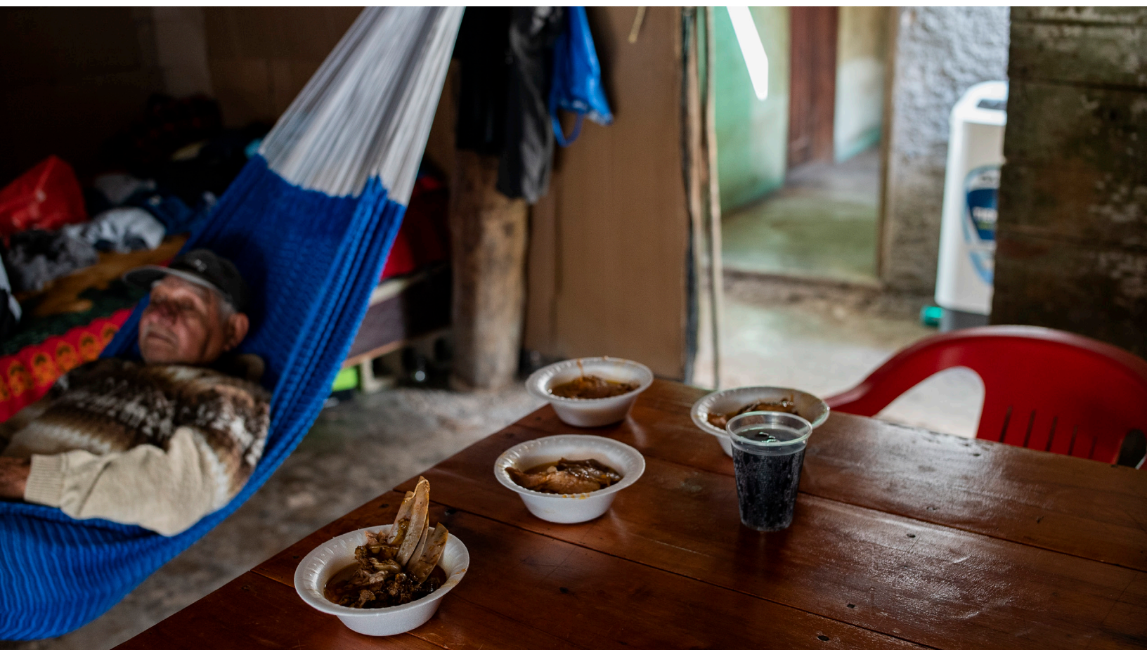
Cochinita / Nuevo Durango, Quintana Roo / / 12.12.2021