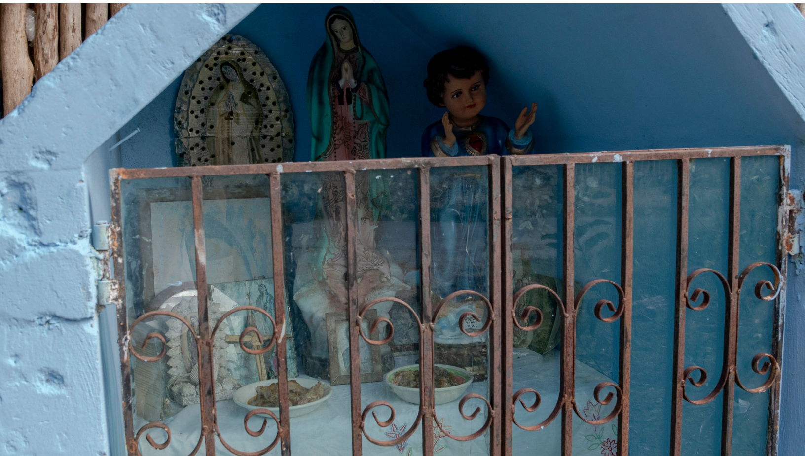
Ofrenda / Nuevo Durango, Quintana Roo / / 12.12.2021