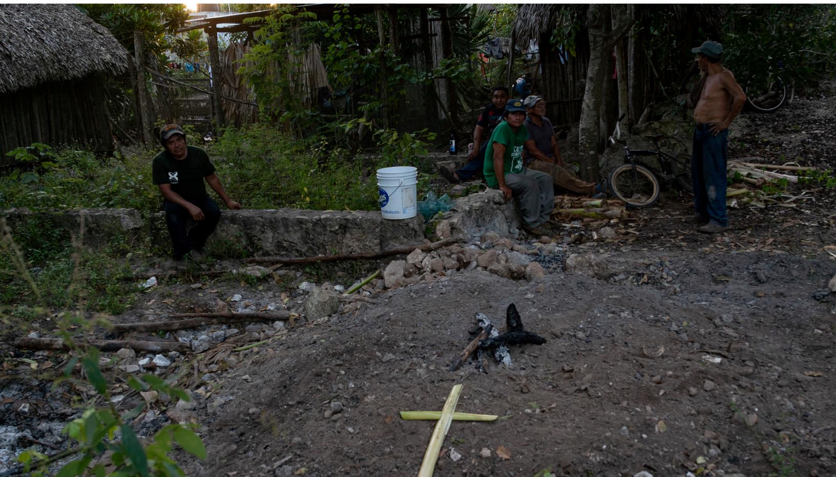
Una cruz sobre los alimentos / Nuevo Durango, Quintana Roo / / 11.12.2021